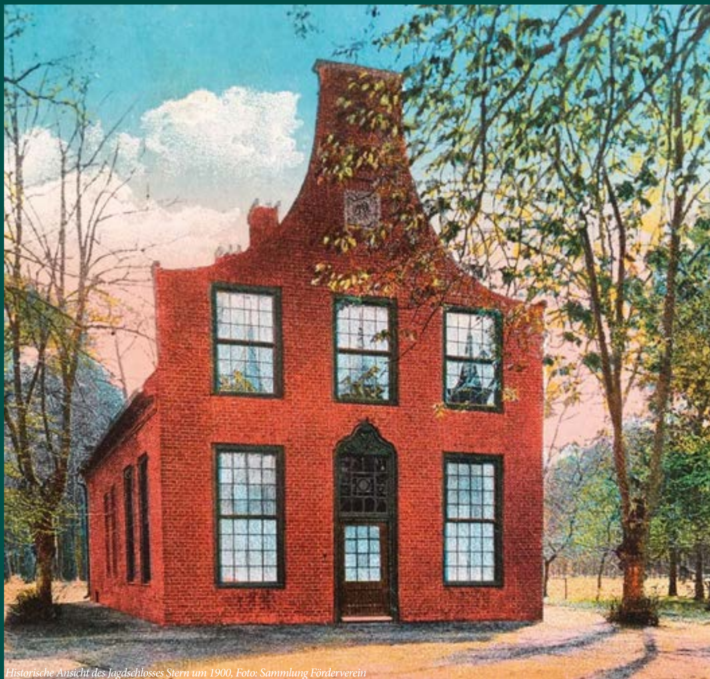
Historische Ansicht des Jagdschlusses Stern um 1900