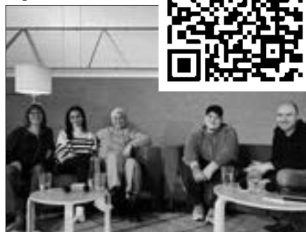
Das Sozialarbeiter-Trio mit ihren Gästen Saphira und Sali (Mitte) vom Tiktok-Kanal „Safespace“

Wer selber mal reinschauen möchte: Auf https://www.tiktok.com/@safespace.offiziell oder den QR-Code kann man sich die Videos von „Safespace“ ansehen.