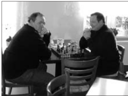
Aphasiker beim Schachspiel

Gerade für Sprachbehinderte ist die ständige Kommunikation mit anderen Menschen sehr wichtig. Deshalb bietet die Selbsthilfegruppe „Aphasie“ seit September vergangenen Jahres im Bürgerhaus „Stern*Zeichen“ einen zusätzlichen Treff einmal im Monat in