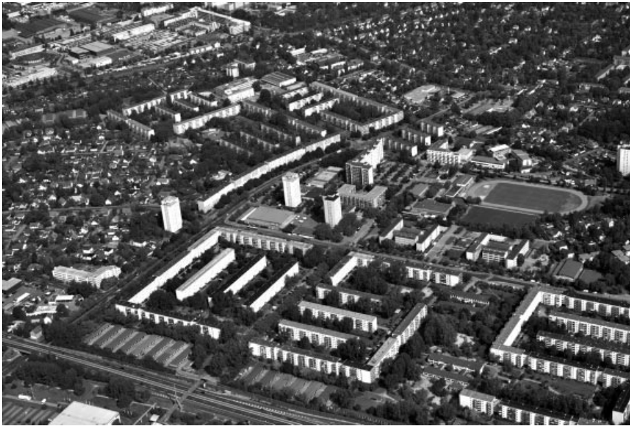
Schrägluftbild Am Stern aus südlicher Richtung

Derzeit wird das Planungsbüro mit dem besten Konzept für die Einbindung aller Beteiligten Am Stern – der Fachleute und der Bewohnerschaft – gesucht. Ab Mitte dieses Jahres kann dann voraussichtlich mit der Planung begonnen werden.