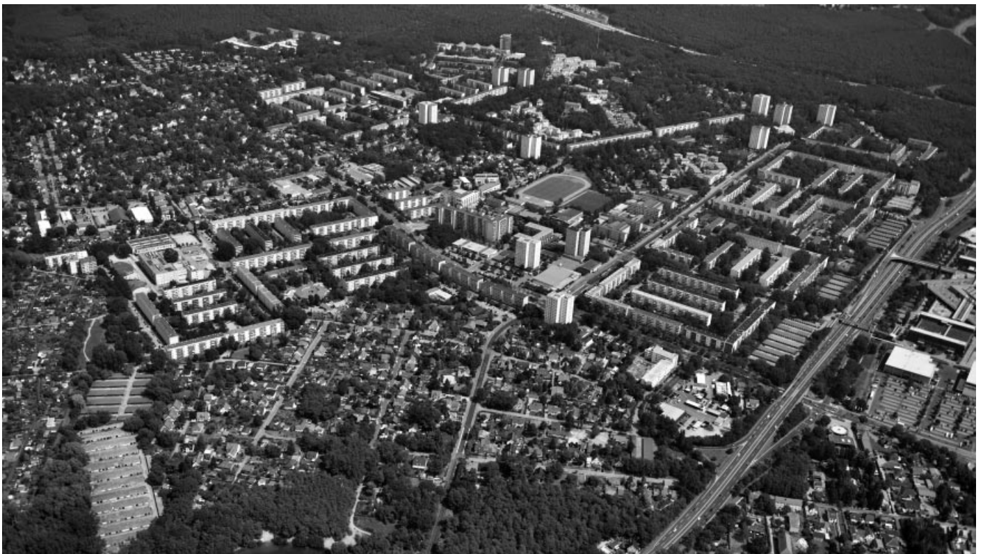
Schrägluftbild Am Stern aus südwestlicher Richtung

Fragen und Anregungen zum Planungsprozess können gerne an Stadtkontor per E-Mail an stern@stadtkontor.de gerichtet werden.