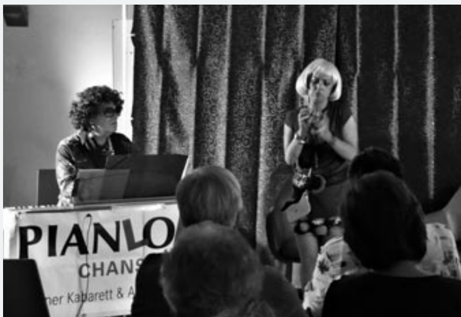
Bei unserem Kabarett begeisterte uns u.a. das Duo PianLOLA mit frechen Texten und bunter Bühnenshow.