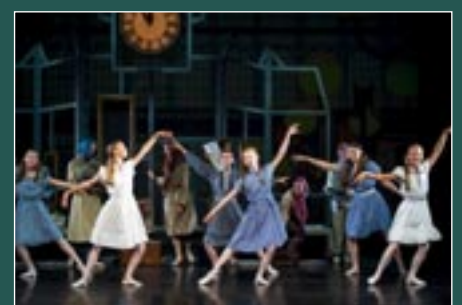
Kultur für JEDE*N