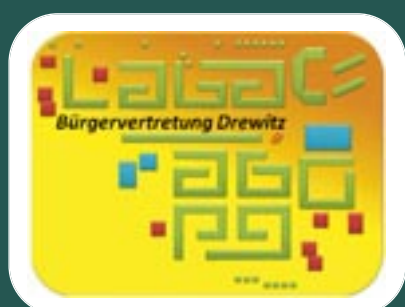
Bürgervertretung Drewitz Seite 4