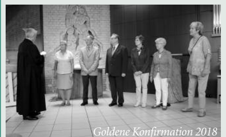
Goldene Konfirmation 2018

Wer Interesse hat, melde sich bitte im Gemeindebüro der Sternkirche (bitte schicken oder bringen Sie uns eine Kopie Ihrer Konfirmationsurkunde).