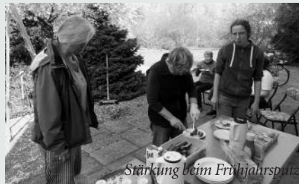
Stärkung beim Frühjahrsputz

Auch rund um die Sternkirche wurde am 6.04.2019 gearbeitet. Stubben von abgestorbenen Sträuchern wurden gerodet, Büsche kräftig beschnitten, geharkt und alles sauber gefegt. Frisch gestrichene Bänke laden nun wieder zum Sitzen und Klönen ein. Gefreut haben sich die fleißigen Helfer*innen über die Bratwürste und Rosmarin-Kartoffeln, die vom Stern*Zeichen den Weg zur Sternkirche fanden.