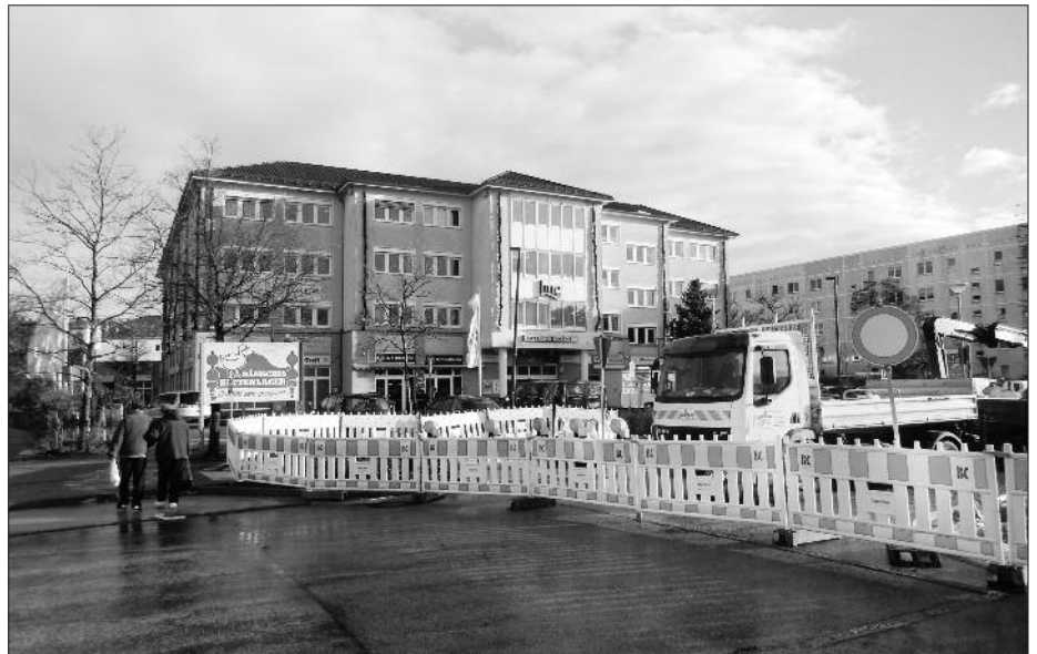
Sanierung Geh- und Radweg zwischen HNC und Gaußstraße

Der Ablauf der Sanierung der Fußgängerquerung an der Fritz-Lang-Straße ist von den Wetterverhältnissen abhängig. Nicht alle Materialien können bei der derzeit nass-kalten Witterung verbaut werden. Geplantes Ziel ist es, in der 7. Kalenderwoche, Mitte Februar, die Fritz-Lang-Straße für den Durchgangsverkehr wieder zu öffnen. Die Herstellung der Gehwege wird sich bis in das Frühjahr ziehen. Die Fußgänger werden gebeten, mit besonderer Vorsicht die Wegeverbindung über den Ernst-Busch-Platz und den Parkplatz des Havel-Nuthe-Centers zu nutzen. Die Autofahrer sind angehalten mit max. 10 km/h über den Parkplatz zu fahren, um die Fußgänger nicht zu gefährden.