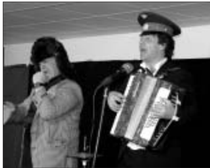
28. November 19.00 Uhr Ungebremste Lebenslust The CRAZY doctors Leipzig

dreißigstes Bühnenjubiläum begeht, hat dazu weder einen roten noch schwarzen Faden, es benutzt das traditionelle Nummerprogramm um gesellschaftliche wie individuelle Situationen satirisch erlebbar zu machen.