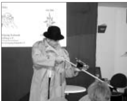
31. Oktober 19.00 Uhr Was wird bleiben?! Die Lutken, Weißwasser

Sie zeigen es mit Spaß am Spiel und innerem Engagement. Natürlich, frech und überzeugend.