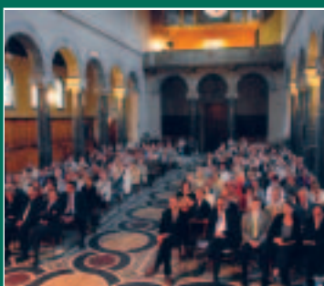
Potsdamer Ehrenamtspreis Seite 5