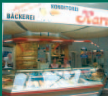
Das HNC stellt sich vor Seite 7