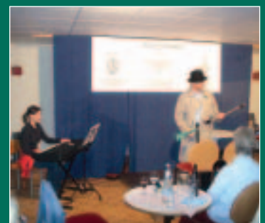
Kabarett im Stern*Zeichen Seite 13