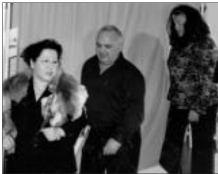
25. September 19.00Uhr Deutschland – ein Märchenland?! Meck Pommers Neustrelitz

Mit seinem siebenten Programm, das am 13. Juni 2008 Premiere hatte, werden die drei Neustrelitzer KabarettisInnen und ihr Musiker im Potsdamer Stern*Zeichen – zum fünften Mal – auftreten. Nach dem „Wintermärchen“ von Heine und dem Sommermärchen der Fußball WM, versuchen sie es märchenhaft mit politischer Satire. Reichliche Stoffe dazu finden sie in unserm Alltagsgeschehen.