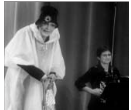
2. November 10.30 Uhr In der Mitte liegt die Lust meck ab! Cottbus in der Reihe SternZeit der 2. kabarettistische Frühschoppen

Stern*Zeichen Galileistraße 37-39 · Tel.0331-600 67 61/62 Club SternKabarett im Stern*Zeichen 5 Jahre Club SternKabarett 2003-2008 ... und weiter mit „Kabarett Am Stern!“ Sprechzeiten des Clubs: Jeden letzten Dienstag im Monat um 16:00 Uhr im Café „Münchhausen“. Nächste Termine: 30. September – 28. Oktober – 25. November