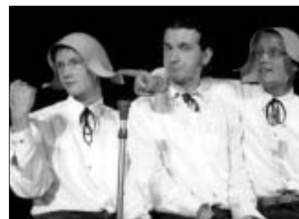
„Prolästerrat“ aus Magdeburg mit dem Programm: BRDigung – Eine Bundes-Horror-Bilder-Schau

Das Finale der 10jährigen Geburtstagsparty ist am 31.03.2006, 19.00 Uhr im Stern*Zeichen