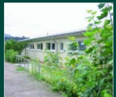
Jugendclub 18 Seite 10