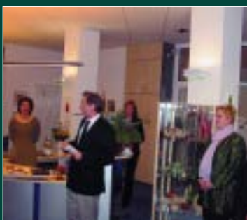
50 Jahre PWG 1956 eG Seite 4