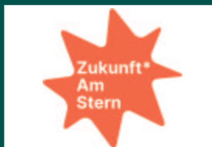
Rahmenplan Am Stern